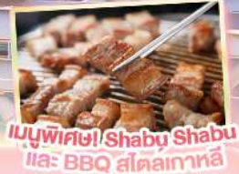
เมนูพิเศษ! Shabu Shabu และ BBQ สเต็กเกาหลี

เดินทาง พฤษภาคม - ตุลาคม 69 สายการบิน AIR BUSAN (BX) น้ำหนักกระเป๋า 15 KG