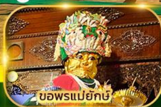
ขอพรแม่ยกษิ