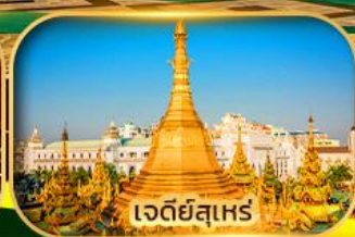
เจดีย์สุเหร่