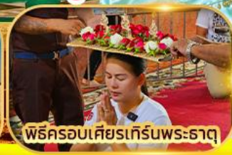
พิธีครอบเศียรเทีร์นพระธาตุ