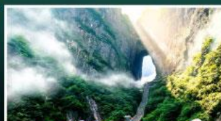
เขาประตูลี้