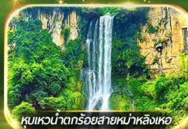
หุบเขาน้ำตกร้อยสายหม่าหลิงเหอ

ชมป่าภูเขาหมื่นยอด, เที่ยวหมู่บ้านโบราณหลินปู้อี ล่องเรือทะเลสาบว่างเฟิงหู, ชมสวนดอกไม้ตามฤดูกาล