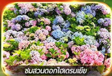
ชมสวนดอกไฮเดรนเยีย