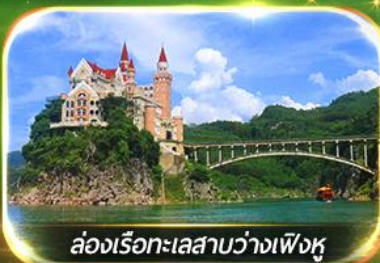
ล่องเรือทะเลสาบว่างเฟิงหู