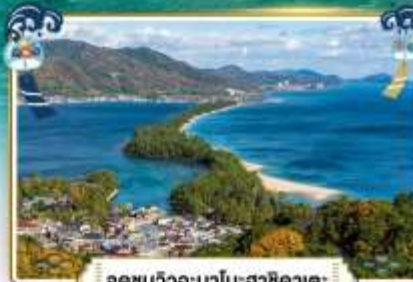
จุดชมวิวอะมาโนฮาซิดาเตะ