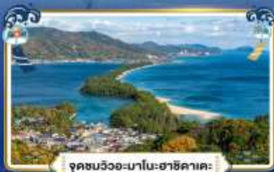
จุดชมวิวกะมาโมะฮาชิคาตะ