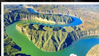
แกรนด์แคนยอนแม่น้ำเหลือง