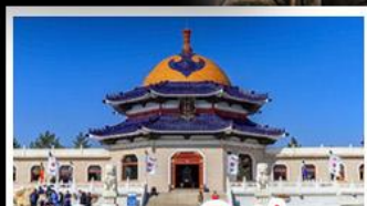
สุสานเจกิสข่าน