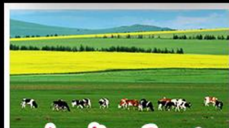
ทุ่งหญ้าฮอร์ดอส

ทุ่งหญ้าฮอร์ดอส สุสานเจกิสข่าน แกรนด์แคนยอนแม่น้ำเหลือง