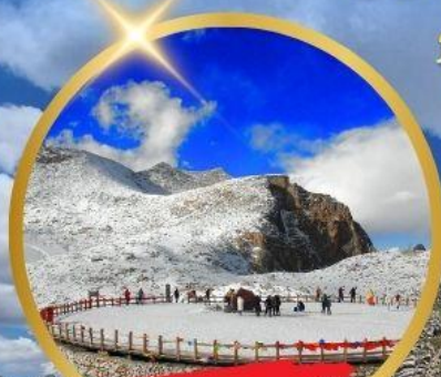
OPTIONAL TOUR ธารน้ำแข็งต้ากู่ปิงชวน