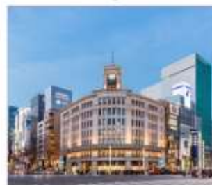
กินข้า้ออปปิ้ง