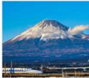
นั่งชินคันเซนชมฟูจิ