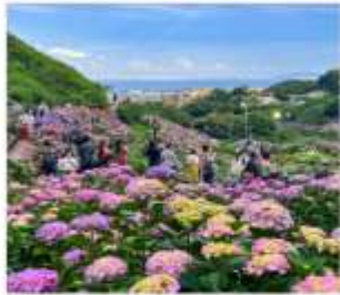
เทศกาลดอกไฮเดรนเยีย