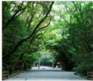
ศาลเจ้าอัสึตะ