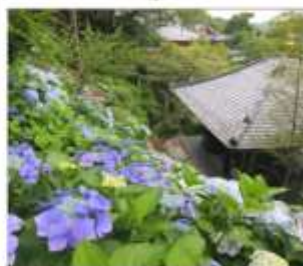
วัดฮาเซเดระ(เดรนเยีย)