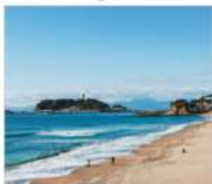
เกาะเอโนชิมะ