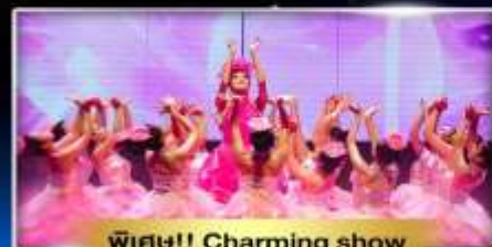
พิเศษ!! Charming show