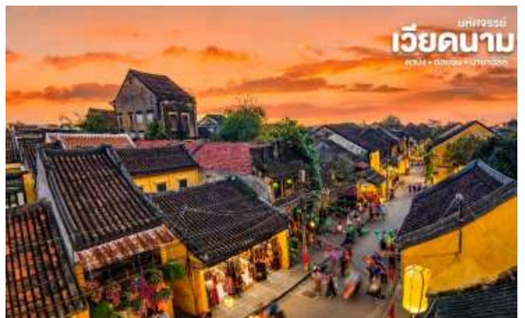
บทวิจารณ์ เวียดนาม ดาบิง • ฮอยอัน • บานาฮิลล์

เมืองฮอยอันนั้นในอดีตเคยเป็นเมืองท่า การค้าที่สำคัญแห่งหนึ่งในเอเชียตะวันออกเฉียงใต้และเป็นศูนย์กลางของการแลกเปลี่ยนวัฒนธรรมระหว่างตะวันตกกับตะวันออกองค์การยูเนสโกได้ประกาศให้ฮอยอันเป็นเมืองมรดกโลกทาง