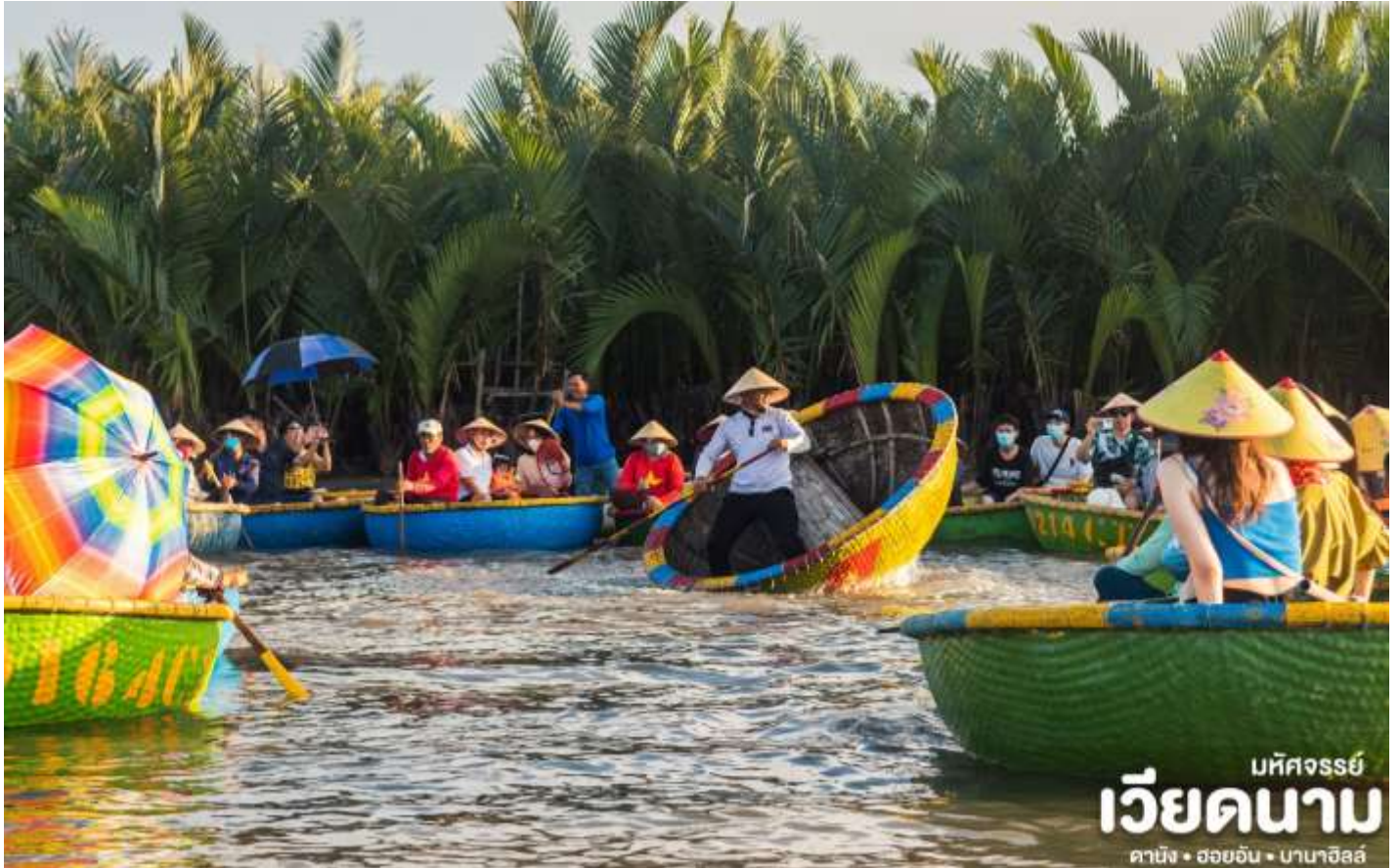
บทวิจารณ์ เวียดนาม ดาบิง • ฮอยอัน • บานาฮิลล์