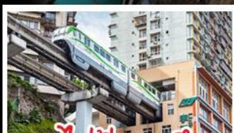
รถไฟทะเลสาบ