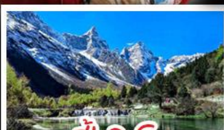
ปี้เฉิงโกว