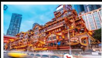
เฉิงเฉิงเฉิง