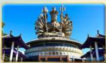
วัดกวงอิมหยวนเต้า