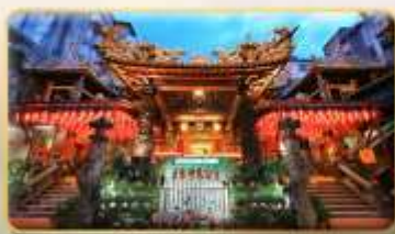
วัดเทียนโฮ่ว จอพรเจ้าแม่หม่าจู