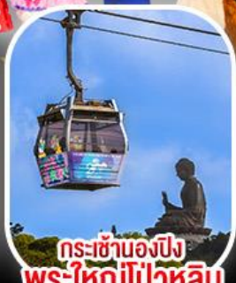
กระเช้าเองปีง พระใหญ่ไผ่หลิน