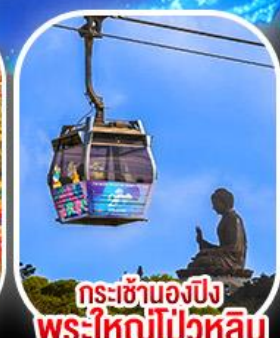
กระเช้าเองปีง พระใหญ่โป่วหลิน