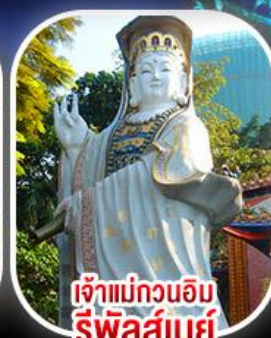
เจ้าแม่กวนอิม รีพัสลีย์