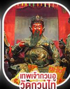
เทพเจ้ากวนอู วัดกวนไท