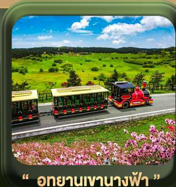
“ อุทยานเขานางฟ้า ”