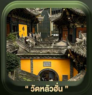
“ วัดหลิวอัน ”