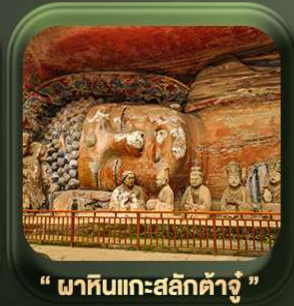
“ พาทินแกะสลักต้าจู้ ”