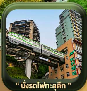
“ นั้รทไฟทะลุดัก ”

บินตรงลงจงซิง • อุ้หลง หลุมฟ้าสะพานสวรรค์ • ละเบียงแก้ว • อุทยานเขานางฟ้า หงหยาดัง • นั้รทไฟทะลุดัก • ศาลาประชาคม (ด้านนอก) • หลงหมินฮ่าว มรดกโลกพาทินแกะสลักต้าจู้ • วัดหลิวอัน • ตึกตะเกียบ • ถนนคนเดินเจียฟ้างเปย