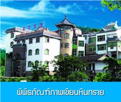
พิพิธภัณฑภาพเขียนหินทราย