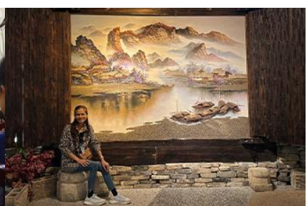
พิพิธภัณฑ์ภาพถ่ายเขียนหินทราย

วันที่สี่ เมืองจางเจียเจี๋ย- ศูนย์ผลิตภัณฑ์หยก –ร้านใบชา – พิพิธภัณฑ์ภาพถ่ายเขียนหินทราย-ไกด์นำเสนอโปรแกรมเสริม สะพานกระจกแกรนด์แคนยอน- เมืองหยี่ซาง