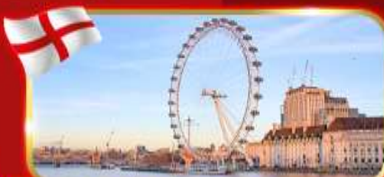
ชมวิวชิงช้าที่สูงที่สุดในยุโรป ลอนดอนอาย