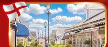
ช้อปปิ้งเอาท์เล็ต Bicester village