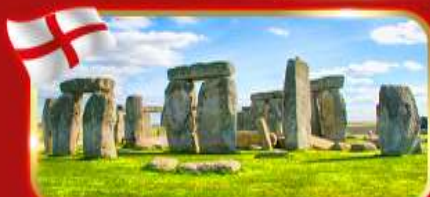
สโตนเฮนจ์ สิ่งมหัศจรรย์ของโลก