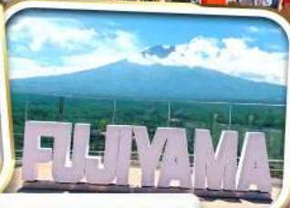
ฟูจิยามา

ราคาเริ่มต้น 22,999 *รวมภาษีมูลค่าเพิ่มแล้ว*