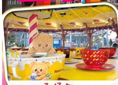
พลาดไม่ได้! BUTTERBEAR X FUJI-Q