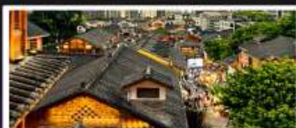
เมืองโบราณสี่ปาที้