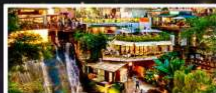
ถนนโบราณหลงเหมินฮ่าว