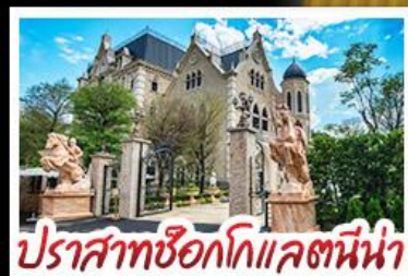
ปราสาทช็อกโกแลตนี้น่า