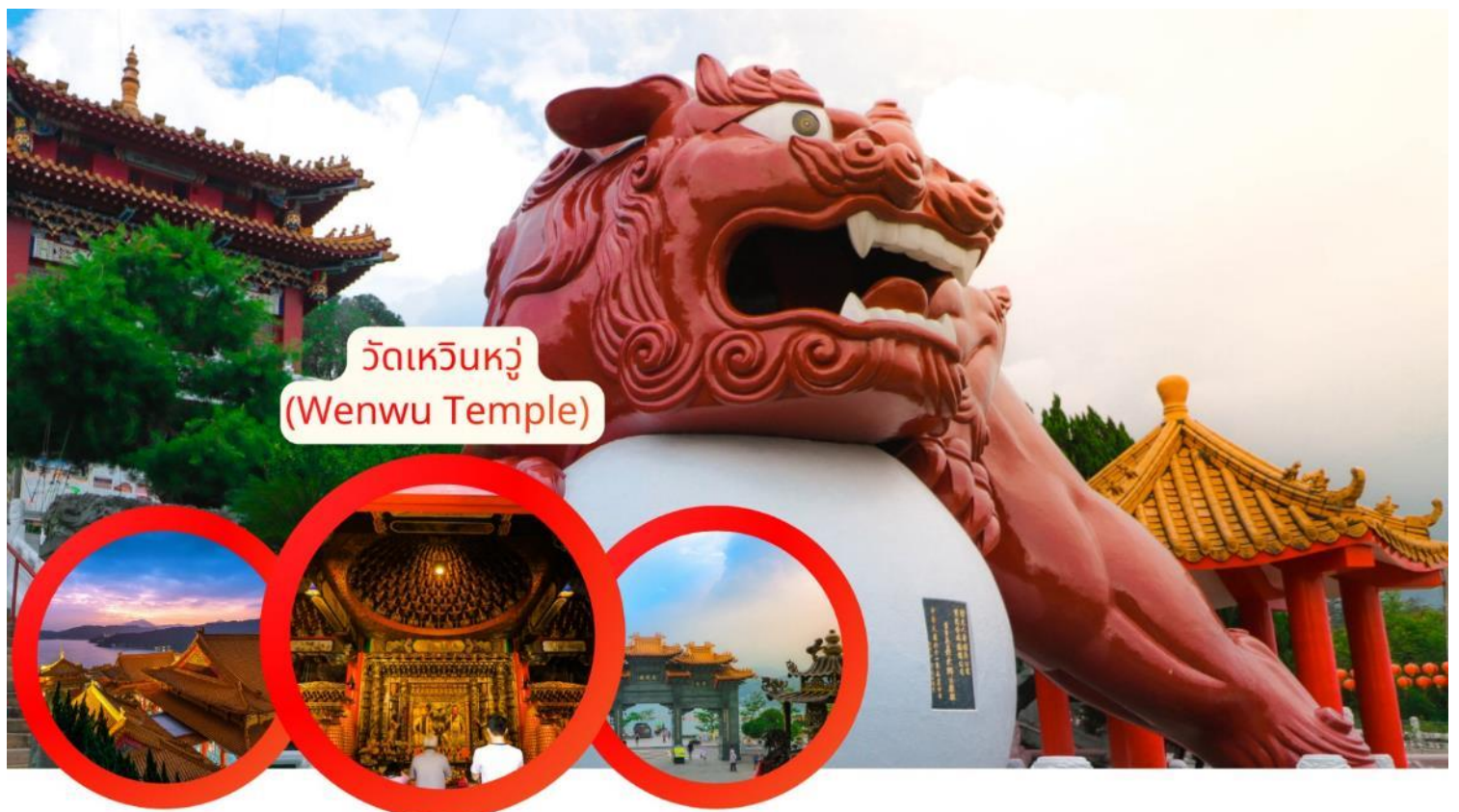
วัดเหวินหวู่ (Wenwu Temple)

เคล็ดลับเสริมดวง: การนำกระดิ่งทองคำ ตามปีนักษัตร เขียนคำอธิษฐานแล้วนำไปแขวนไว้ตามวันเกิดของตัวเองที่บันได 366 ขั้น เชื่อว่าจะทำให้เสียงกระดิ่งส่งคำขอถึงสรวงสวรรค์