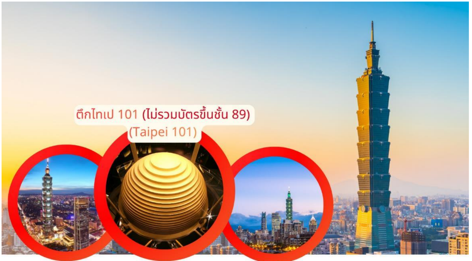
ตึกไทเป 101 (ไม่รวมบัตรขึ้นชั้น 89) (Taipei 101)

เดินทางกลับสู่ กรุงเทพฯ แวะชม ตึกไทเป 101 (ไม่รวมบัตรขึ้นชั้น 89) แต่สามารถถ่ายภาพและชมสถาปัตยกรรมสูงเด่น ที่ถือเป็นสัญลักษณ์ของเมืองและความทันสมัยของไต้หวัน