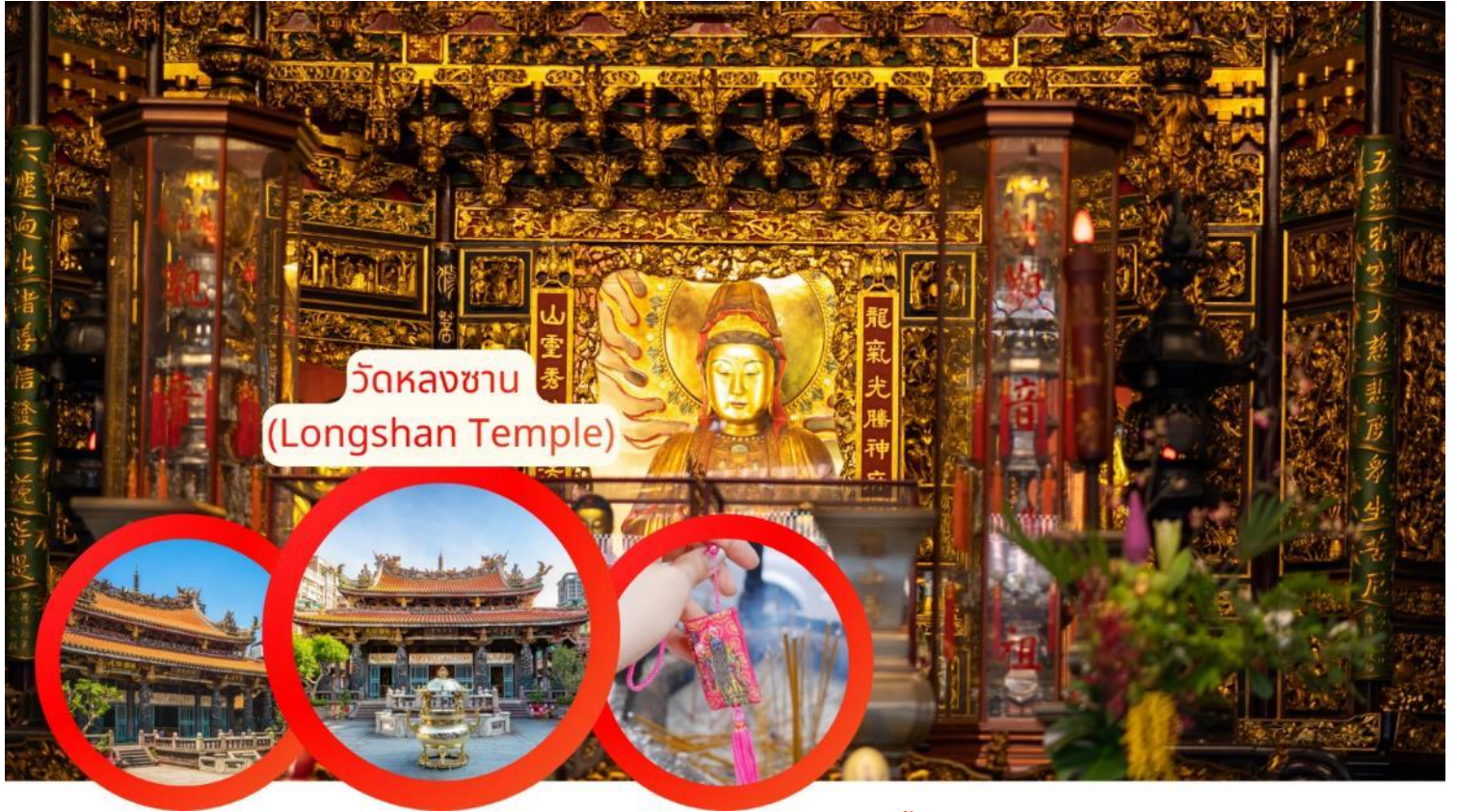
วัดหลงซาน (Longshan Temple)

กลางวัน รับประทานอาหารกลางวัน Xiao Long Bao (เสี่ยวหลงเปา) (มื้อที่ 8)