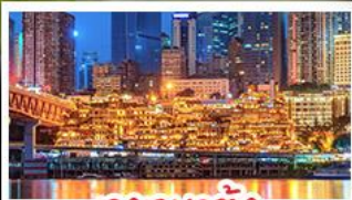
เฉงเฉาตั้ง