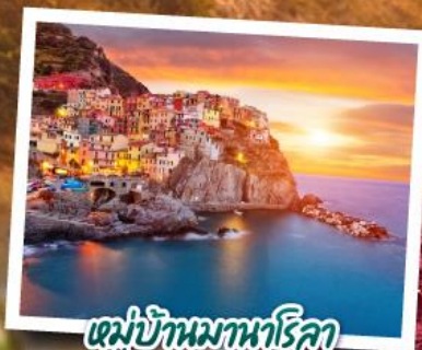
หมู่บ้านมานาโรลา