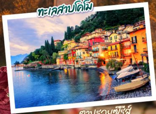
ตามรอยซีรีส์