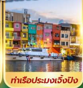
ท่าเรือประมงเจิ้งปิง