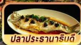
ปลาประรานาธิบดี