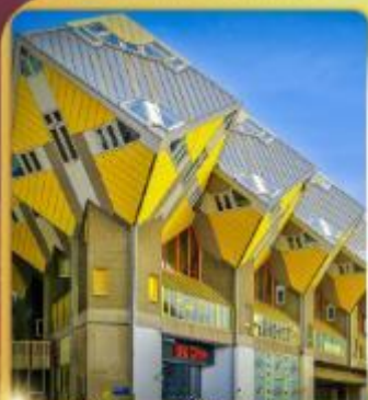
บ้านลูกเต่า โคกคูมูส

“ล่องเรือหลังคากระจก” ชมกรุงอัมสเตอร์ดัม