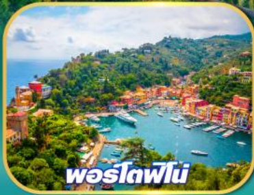
โพสโตฟิโน