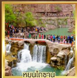
หยุนโกซาน