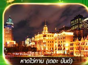
หาดไข่มุก (เดอะ บันด์)

เที่ยวมหานครเซี่ยงไฮ้ ถ่ายรูปเช็กอินที่ Tian An 1000 Trees, ซินเทียนตี้ ช้อปปิ้งตลาดเงินหวงเหมียว, ถนนนานกิง