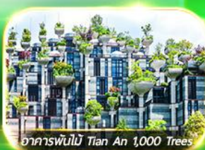
อาคารพันไม้ Tian An 1,000 Trees