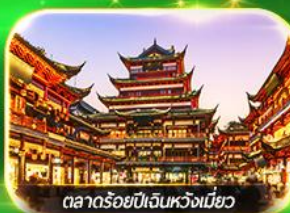
ตลาดร้อยปีเงินหวงเหมียว