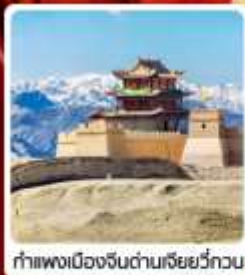
กำแพงเมืองจีนด่านเสี่ยวว่กวน

• ไซโล่...เส้นทางสายไหม ชมสระน้ำวังพระจันทร์ ทะเลทรายหมีงาช้าง กำแพงเมืองจีนด่านสุดท้าย "เจียยวี่กวน" มรดกโลกภูเขาสายรุ้งจางเย่