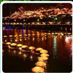
เมืองเซียนเอน

• โฮเทล อูยกานเทียนเหมินซาน หุบเขาอวตาร เมืองโบราณเซียนเอน หมู่บ้านโบราณฟูรงเจิน ภูเขาโรมาอู่จียโต อูยกานชื่อจื่อกวนด่านสิงโต