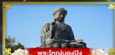
พระใหญ่ของปิง