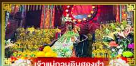
เจ้าแม่กวนอิมสองฮา

เที่ยว 2 เมือง ขึ้นไปมุกที่เกาะฮ่องกง เที่ยวจุให้สวนสนุกและอควาเรียมที่ใหญ่ที่สุดในเอเชีย