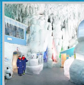
"KAMIKAWA ICE PAVILLION"