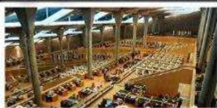
ห้องสมุดอเล็กซานเดรีย