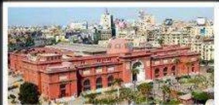
พิพิธภัณฑ์สถานแห่งอียิปต์