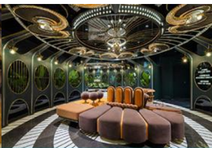
ห้องน้ำไอเทค