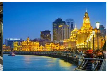
หาดไว่กาน