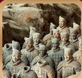
“สุสานจีนซีฮ่องเต้”