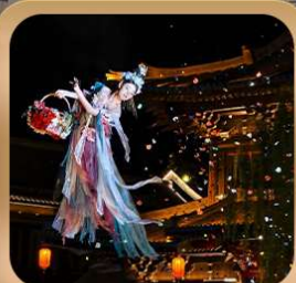
“เมืองโบราณลั่วอี้”

ชมถ้ำหลงเหมิน มรดกโลกที่เมืองลั่วหยาง • สุสานจีนซีฮ่องเต้ • ศาลเจ้ากวนอู วัดเส้าหลิน + ป่าเจดีย์ + ชมโชว์กังฟู • เมืองโบราณลั่วอี้ • อุทยานหยุนไท่ซาน เจดีย์ห้าพันปี • ถนนวัฒนธรรมต้าถัง • ถนนคนเดินอิสลาม • จัตุรัสหอระฆัง