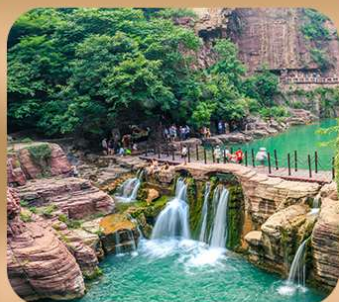
“อุทยานหยุนไท่ซาน”

ชมถ้ำหลงเหมิน มรดกโลกที่เมืองลั่วหยาง • สุสานจีนซีฮ่องเต้ • ศาลเจ้ากวนอู วัดเส้าหลิน + ป่าเจดีย์ + ชมโชว์กังฟู • เมืองโบราณลั่วอี้ • อุทยานหยุนไท่ซาน เจดีย์ห้าพันปี • ถนนวัฒนธรรมต้าถัง • ถนนคนเดินอิสลาม • จัตุรัสหอระฆัง