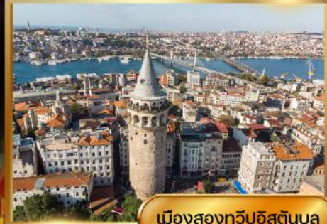
เมืองสองทวีปอิสตันบูล