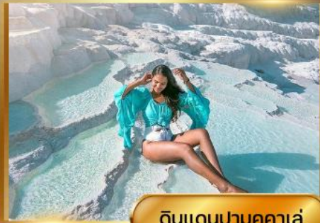
ดินแดนปามุคคาเล่