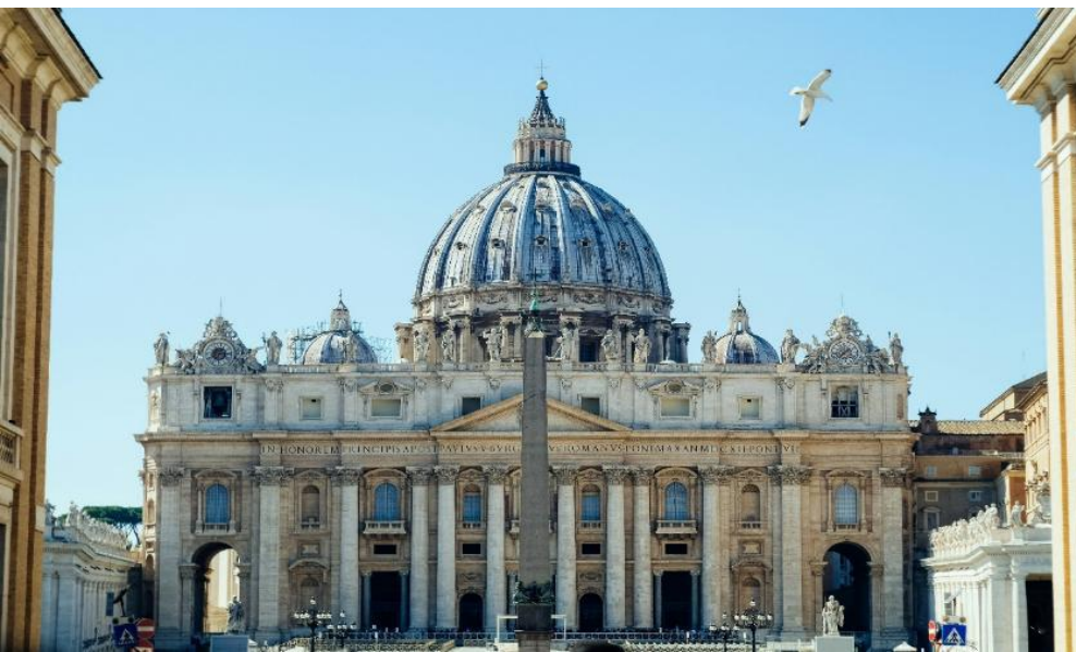
มหาวิหารนักบุญปีเตอร์ ( ST. PETER' BASILICA)

(กรณีมีพิธีด้านใน หรือถ้าหากมีผู้เข้าชมเป็นจำนวนมากจนไม่สามารถเข้าชมได้ทันเวลา ทั้งนี้เพื่อมิให้กระทบต่อกำหนดการท่องเที่ยวอื่นๆ ภายในโปรแกรมทัวร์" อาจจะไม่ได้รับการเข้าชม)