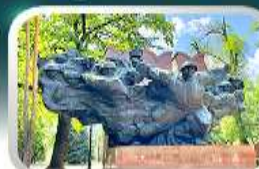
Panfilov Guardsmen Park