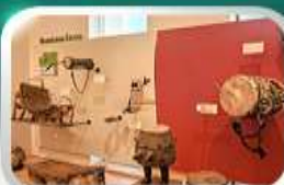
Museum of Folk Instrument