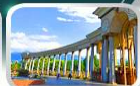
1st President Park