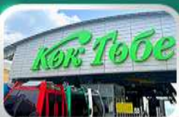
ซิ่นโทกโทเบชมวิวอัลมาตี

นั่งกระเช้าซิมบูลัค • ทะเลสาบโคลไซ • โบสถ์เซนต์คอป