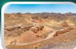
ชารินแกรนด์แคนยอน