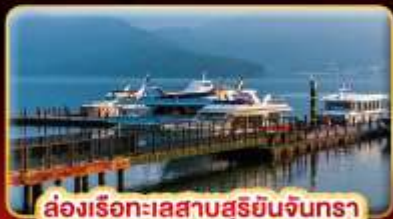
ล่องเรือทะเลสาบสุริยขึ้นจินทรา

บ๊ี้แด้ม STREET FOOD แบบจุใจ ขอความรักวัดแดงชาแน