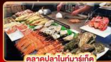
ตลาดปลาไถ่ท์มาร์เก็ต