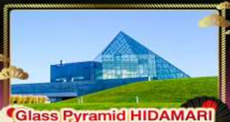
• Glass Pyramid HIDAMARI