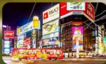
ซูปป์ิงย่านซูซุกิโนะ