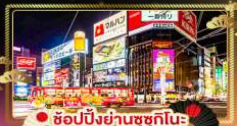
• ช้อปปิ้งย่านซุกุทึโนะ