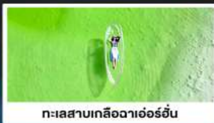
ทะเลสาบเกลือดาเอ๋อร์อัน