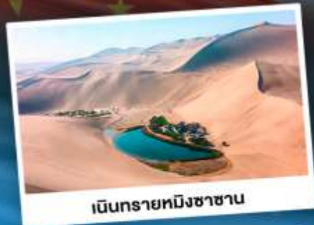
เนินทรายหมิงซาซาน