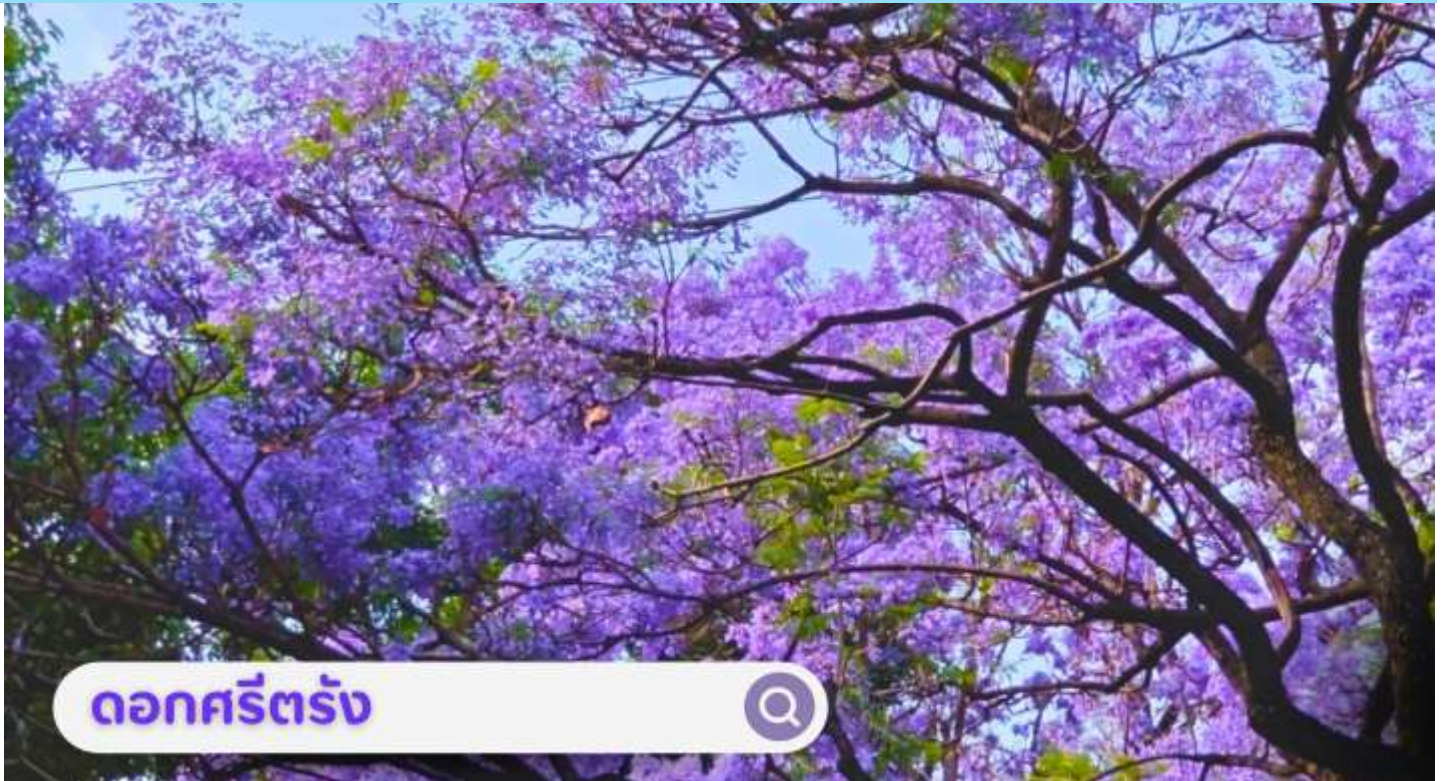
ดอกศรีตรัง

เดือนกันยายน: นำท่านชม ตลาดดอกไม้ไต้หวัน เป็นตลาดค้าส่งดอกไม้ที่ใหญ่ที่สุดของจีน เปิดทำการค้าตลอด 24 ชั่วโมง ไม่มีช่วงเวลาปิดทำการ โดยในปี 2566 ตลาดดอกไม้ไต้หวันมีปริมาณการซื้อขายดอกไม้โดยเฉลี่ยรวม 13,540 ล้านบาท คิดเป็นมูลค่า 13,570 ล้านบาท ถือเป็นตลาดค้าปลีก-ส่ง ผลิตผลทางการเกษตรที่ใหญ่ที่สุดในประเทศจีนอีกด้วย