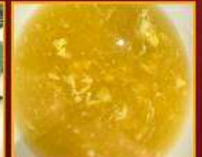
ซุ๊ปข้าวโพด