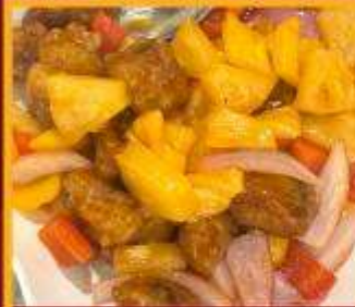
กระดุกหมูผัดเปรี้ยวหวาน