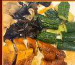
ไก่ แดงกวา เห็ดหูหนู