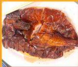
ท่านอย่าง