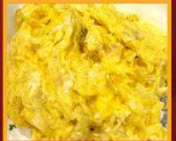
ไข่เจียวทรงเครื่อง