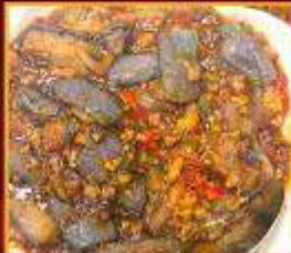
มะเขืออบหม้อดิน