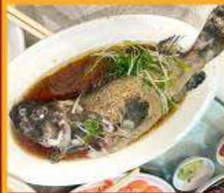
ปลาหนึ่งซีอิ๊ว