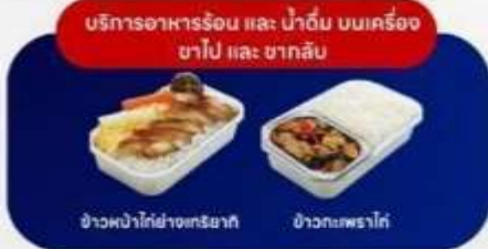
บริการอาหารร้อน และ น้ำดื่ม บนเครื่อง ขาไป และ ขากลับ