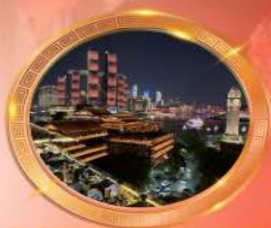
มือค้ำร้านอาหารวิวหลักล้าน