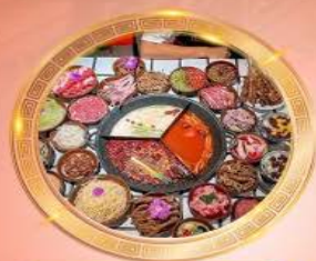
บุฟเฟต์หม้อไฟลงชิง