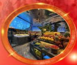
มือพิเศษ บุฟเฟต์นานาชาติ