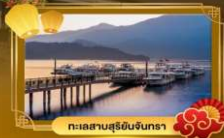
ทะเลสาบสุริยอินจันตรา