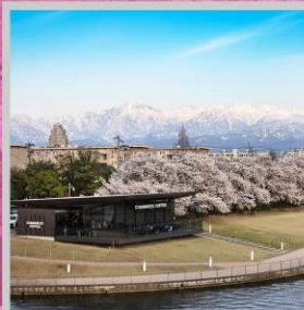
"TOYAMA KANSUI PARK"