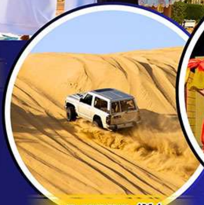
รถเช่าราย 4X4