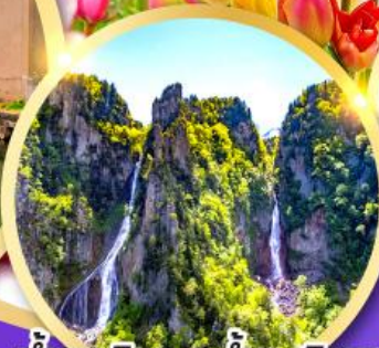
น้ำตกกิ่งกะ-น้ำตกริวเซ