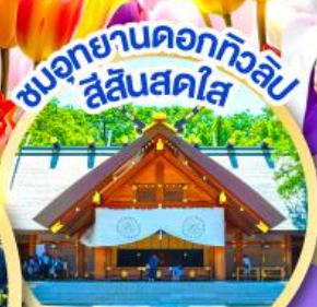
ชมอุทยานดอกทิวลิป สีสันสดใส