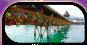
สะพานไม้ชาเปล คูชีริน