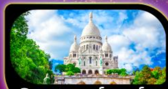
วิหารสกรเทอร์ มงมาร์ต