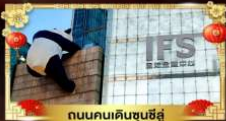
ถนนคนเดินชุนชี่อู่

เที่ยวอุทยานสวรรค์ระดับ 5A จี๋จ้ายโกว "กู๋เจาสีดรุณี" อุทยานชื่อดังเหนียงชาน